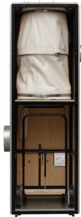
Filterdel BZ11 - indvendig