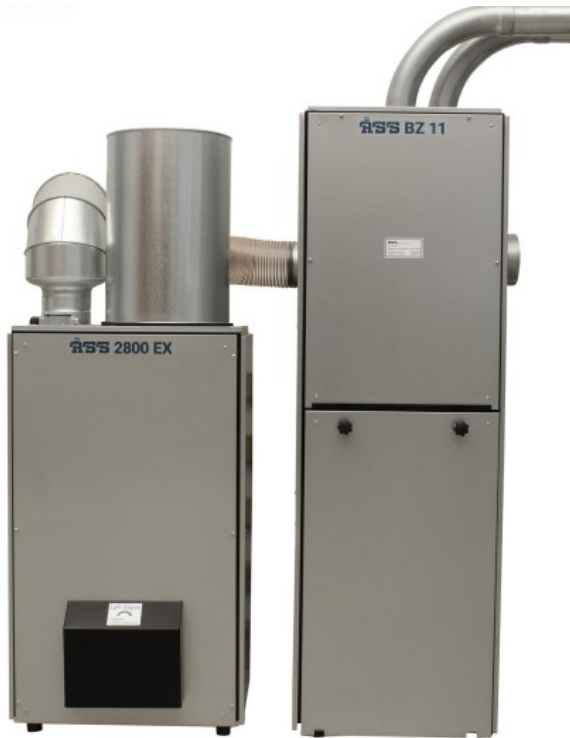
Filterdel BZ11 i kombination med ÅSS Ventilator 2800 EX